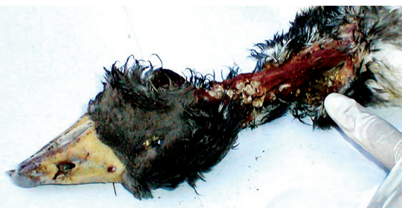
אווזים רבים מתים בייסורים עקב פצעים ודלקות בושט

אווזים רבים מתים בייסורים עקב התבקעות מערכת העיכול, קרעים במעיים ובכבד, פצעים ודלקות בושט, ועוד. האווז נשחט בהיותו גוסס, סובל מקשוי נשימה (הכבד המוגדל לוחץ על הריאות), מחוסר יכולת לנוע ומכאבי תופת.